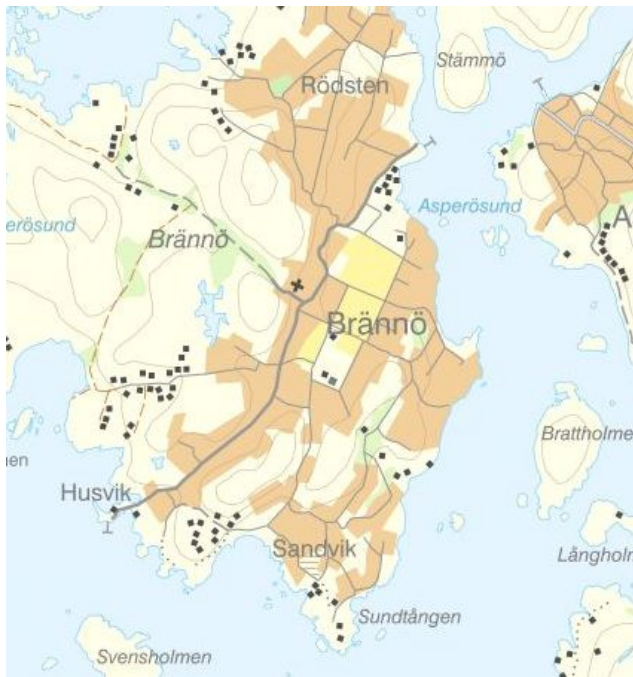
Figur 1 - Sammanhållen bebyggelse (Naturvårdsverket, Lantmäteriet, Geodatasamverkan)