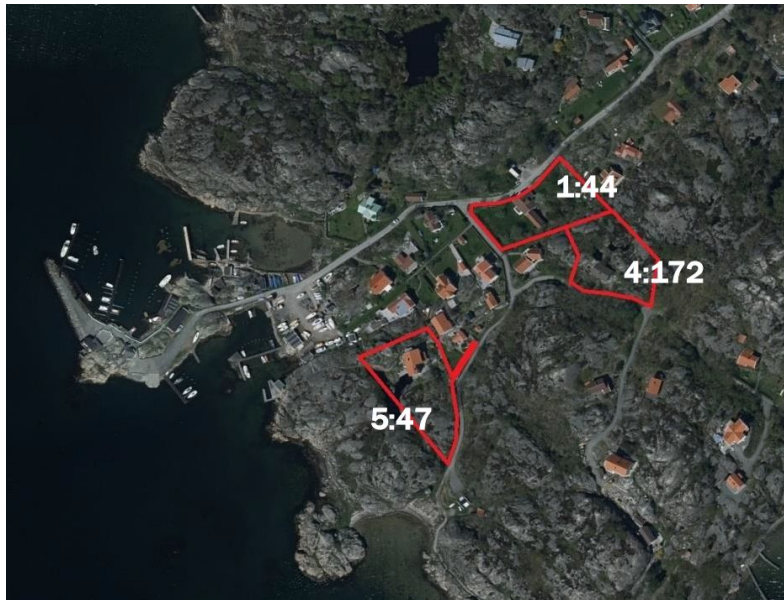
Figur 3 - Karta med ingående fastigheter (Planbeskrivning, s 2)